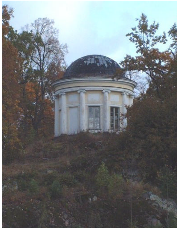
Minnestempel över Christina Piper

På 1780-talet omgärdades parken med staket bestående av tjärade spjälpartier mellan kraftiga putsade trähusförsedda tegelstolpar. Staketstolparna är nyrenoverade medan spjälorna återstår. Trädgårdsanläggningen mellan orangeriet och trädgårdsmästarebostaden avgränsades i norr och öster av en hög putsad tegelmur.