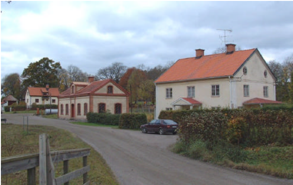
Vita huset, Gamla smedjan och i bakgrunden en av de båda smedbostäderna.

En bit väster om Vita bostaden uppfördes två arbetarbostäder åt godsets smeder, benämnda den södra och norra smedbostaden. Båda husen var låga timmerbyggnader, vars fasader putsats och försetts med pilastrar i hörnen. Till husen hörde en gemensam rödfärgad bodlänga med locklistpanel. Smedsbostäderna tillhör byggnadsminnesområdet.