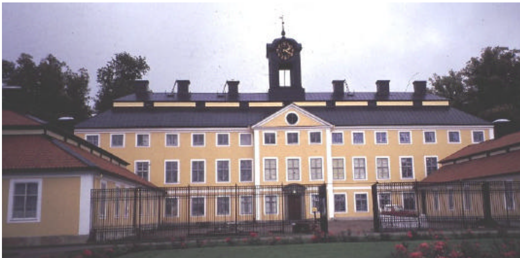
Sturefors slott med flyglar.

Huvudbyggnadens stora sal i andra våningen var ett monumentalt rum som gick som en mittaxel rakt över huset, täckt av ett högt spegelvalv dekorerad efter Tessins ritningar. Nils Adam Bielke igångsatte på 1750-talet ett omfattande inredningsarbete på slottet. Han anlät som arkitekt hovintendenten Jean Eric Rehn. Huvudvåningen en trappa upp moderniserades på rokokomanér och inreddes till en kombinerad bostads- och paradvåning. Den stora salens väggar försågs med väggmålningar utförda av hovmålaren Johan Pasch. Grevinnans kabinett inreddes i kinesisk stil, troligen inspirerat av China slott.