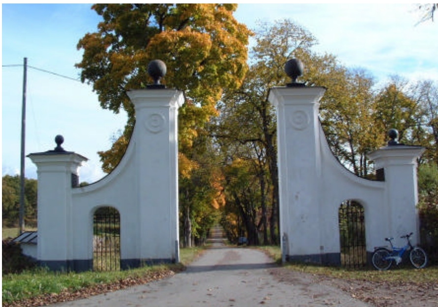
Entrén till Sturefors slott.

Stora vitkalkade entréportaler finns vid infarterna till slottsområdet och understryker upplevelsen av riksintresset som ett herrgårdslandskap. Liksom den allé som leder fram till slottet. Vägen fortsatte förr norrut längs sjön och ån upp till Sundet och passerade via en bro över Stångån. Vägen till Grebo passerade rakt över forsbron och söderut.