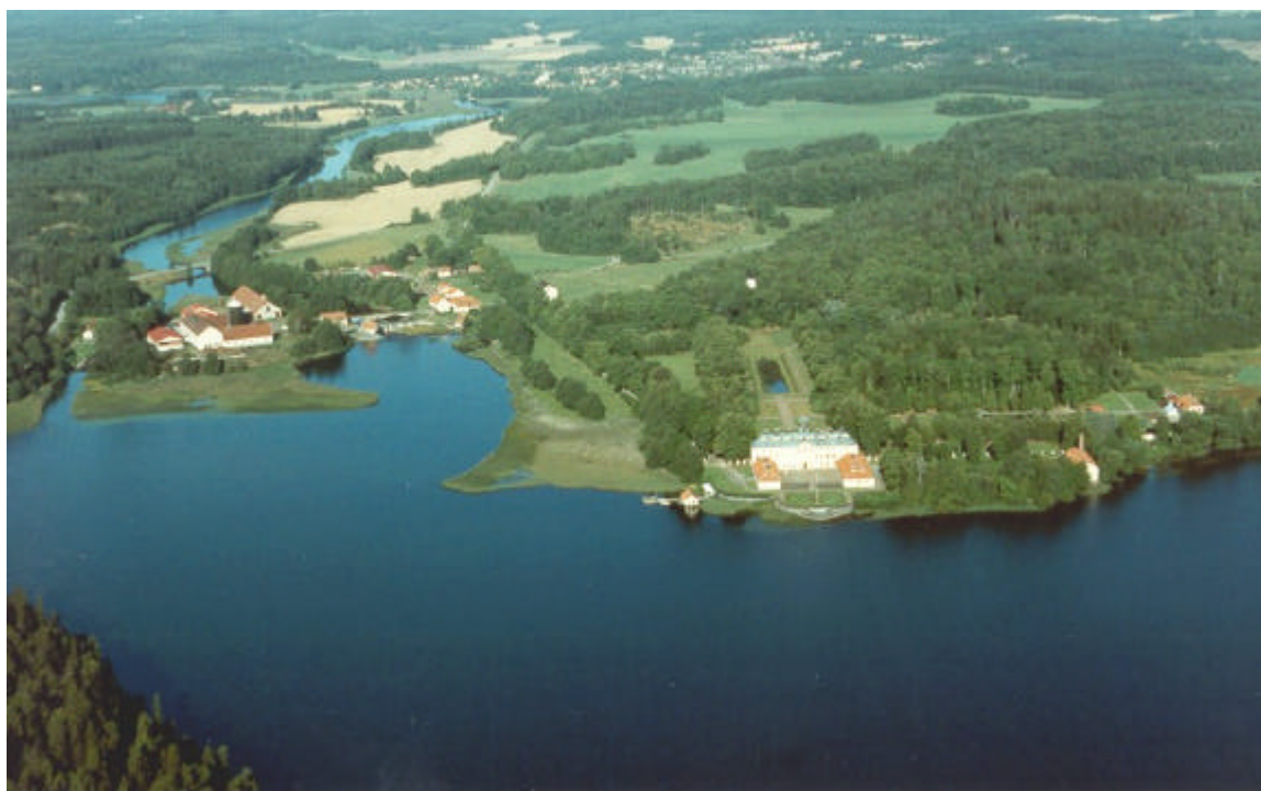
Vy över Sturefors slott mot väster. 1991.

Slottet med slottsbebyggelse samt parkområde byggnadsminnesförklarades år 1976.