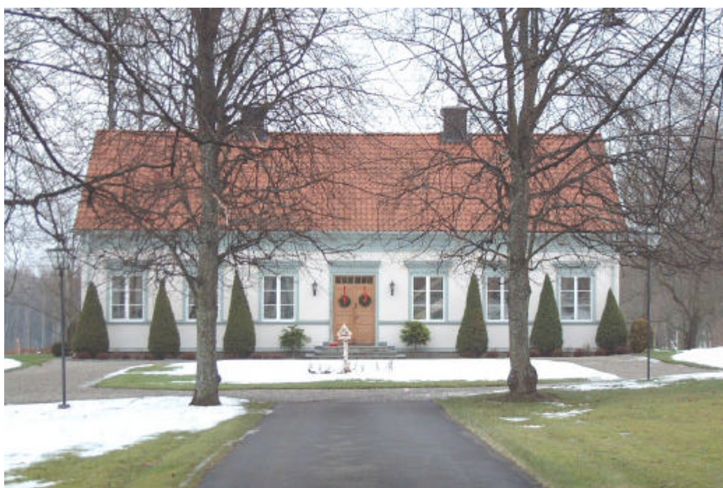
Prästgården. 2002.

Prästgårdens manbyggnad är uppförd av timmer i en våning med vindsvåning, med en stram och elegant ljusgrå putsad fasad. De profilerade fönsteromfattningarna samt överstycken är har en mörkare grå nyans. Byggnaden renoverades år 1970. Bostadshuset flankeras av två timrade och rödfärgade flyglar, ett magasin och ett garage. Eftersom prästen för sin utkomst även var beroende av jordbruket hörde också ekonomibyggnader till prästgården. De placerades norr om bostadsdelen och den (då) parkliknande trädgården. Bebyggelsen bestod ursprungligen av stall, ladugård, lada, svinhus samt höns hus. Endast ladugården och stallet finns kvar. De är uppförda i skiftesverk och fasaderna är traditionsenligt målade med falu rödfärg med vitmålade detaljer samt svarta dörrar. Gården är numera i privat ägo.