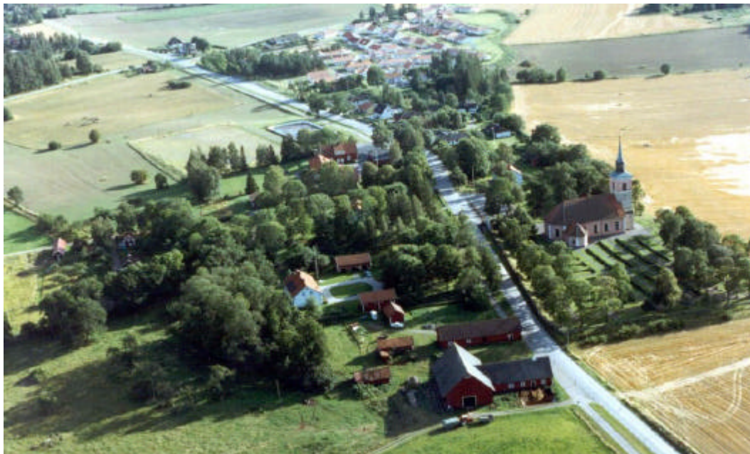
Slaka kyrkby, mot SSV. 1991.

Åsdymlingen söder om Slaka var sedan gammalt en allmänning av inskränkt omfång. Området uppmättes år 1795 och fastställdes året därpå som Hanekinds häradsallmänning. Inom socknen fanns ett flertal häradsjordar, sk häradslyckor. Åsdymlingen nyttjades i norr som åker och betesmark och i söder låg förr en mängd småhus på ofri grund. De är nu till större delen rivna eller ombyggda. I slutningen mellan Slakaåsens rygg och Lilla Aska gård, söder om Askavägen låg socknens avrättningsplats, den sk Rättareplatsen. Numera går platsen under benämningen Galgbacken.