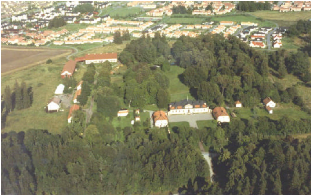
Lambohovs herrgård, mot Ö. 1991.

Lambohovs säteri tillhörde släkten Sinclair fram till 1800-talets mitt och därefter avlöste en rad ägare varandra för att efter 1921 komma i släkten Cederbaums ägo. År 1966 köptes hela egendomen av Linköpings stad. Herrgården fungerar fortfarande som privatbostad och den norra flygeln är bostad åt inspektoren. Lambohovs säteri förklarades som byggnadsminne 1967. Byggnadsminnet omfattar 9 byggnader.