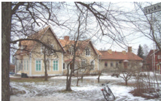
Skolhus uppfört i slutet av 1800-talet... Foto Länsstyrelsen. 2002.

Socknens barnantal ökade och skolorådet beslöt därför 1897, att bygga ett nytt och tidsenligt folkskolehus med sal för 60 barn samt slöjdsal, kommunalrum samt bostad åt skolläraren och klockaren. Ett par år senare stod byggnaden klar intill småskolan och benämndes kommunalhuset. Huset byggdes i trä i en våning med vindsvåning. Fasaden reveterades och putsades i ljusgul färg. Långsidans frontespiser fick rikt dekorerade gavelspetsarna och de höga fönstren utsmyckades med profilerade överstycken. Byggnaden reoverades 1943. På den tiden innehöll den två lägenheter på övre våningen och på nedre våningen fanns gymnastiksal (den gamla skolsalen) samt kommunalrum, som användes som klassrum, samt skolkök. Numera är gymnastik och fritidshemsverksamhet inrymd i lokalen.