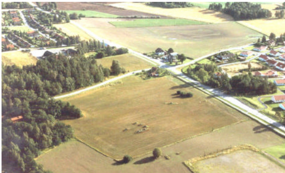
Rester av domarringarna vid Slaka. Foto mot SV, Jan Norrman, Riksantikvarieämbetet. 1991.

Inom riksintresset finns också rester efter den äldre järnålderns hägnadsmurar, s k stensträngar. Stensträngarna syns idag som låga stenrader i marken, men har en gång i tiden varit tillräckligt höga för att utestänga boskapen från åker och äng. Genom långa fägor