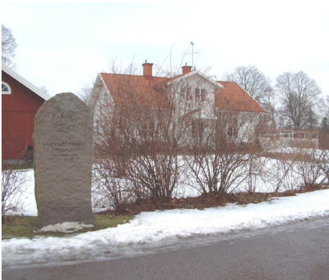
Minnessten över Hanekinds härads tingsplats, rest 1969. I bakgrunden f d småskolan uppförd år 1874. 2002.

På 1850-talet blev det vanligare att den urtima lagen, dvs extra sammanträden med häradsrätten, förlades till annan ort än Slaka och efter några år hölls samtliga ting i Linköping. Vid mitten av 1800-talet var tingshusbebyggelsen förfallen och år 1870 beslöt man att riva husen. På fastigheten uppfördes år 1874 en småskolebyggnad.