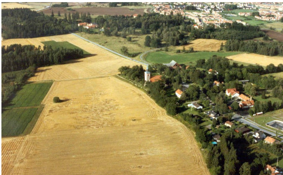
Slaka kyrkby i förgrunden och längs vägen norr om byn ligger Lambohovs herrgård. I nordost den nybyggda stadsdelen Lambohov. Foto Jan Norrman, Riksantikvarieämbetet. 1991.

Lambohovs egendom på 186 hektar förvärvades år 1966 av Linköpings stad för att ge plats åt den expanderande staden och dess blivande universitet. Den nya stadsdelen Lambohov har växt mot sydost och gränsar mot säteriets fruktträdgård.