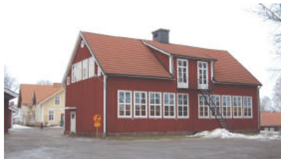
och folkskolan från år 1923.