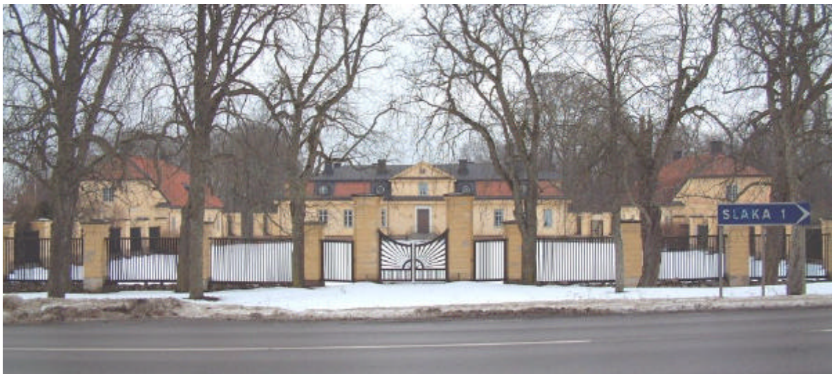
Lambohovs herrgård. 2002.

Huvudbyggnaden fick en franskinspirerad planlösning med bostadssviter på båda sidor om entrén och en paradvit med sal mot parksidan. Rehn svarade även för inredningen och rummen försågs med målade tapeter, dörröverstycken och väggfält samt dekorerade kakelugnar. Nästan alla rum har kvar sin ursprungliga inredning. Herrgården restaurerades och moderniserades år 1931 och 1964. På 1970-talet utfördes en utvändig restaurering, varvid herrgårdens ursprungliga gula putsfärg återställdes.