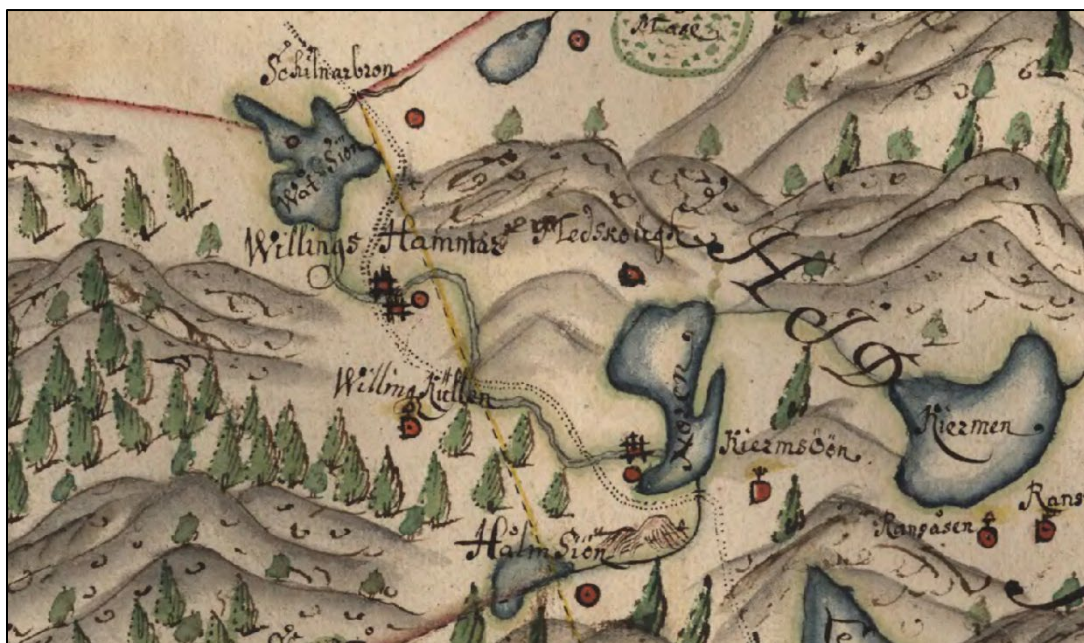
Tångeråsa socken år 1688. Willings Hammar samt två symboler för hammare.

1805–1806, Willingsbergs Stångjärns Bruk och gård, hammare, kvarn