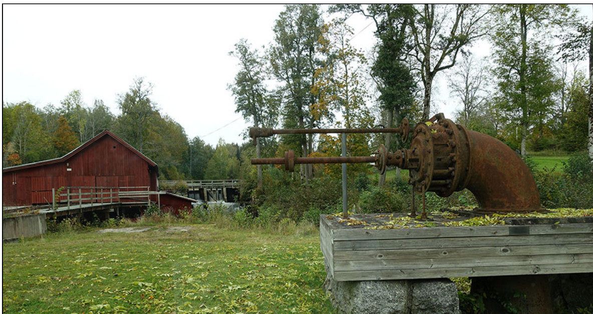
Platsen där hammaren L1981:4633 har legat.