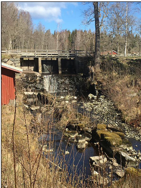
I bakgrunden dammvall L2020:3727.