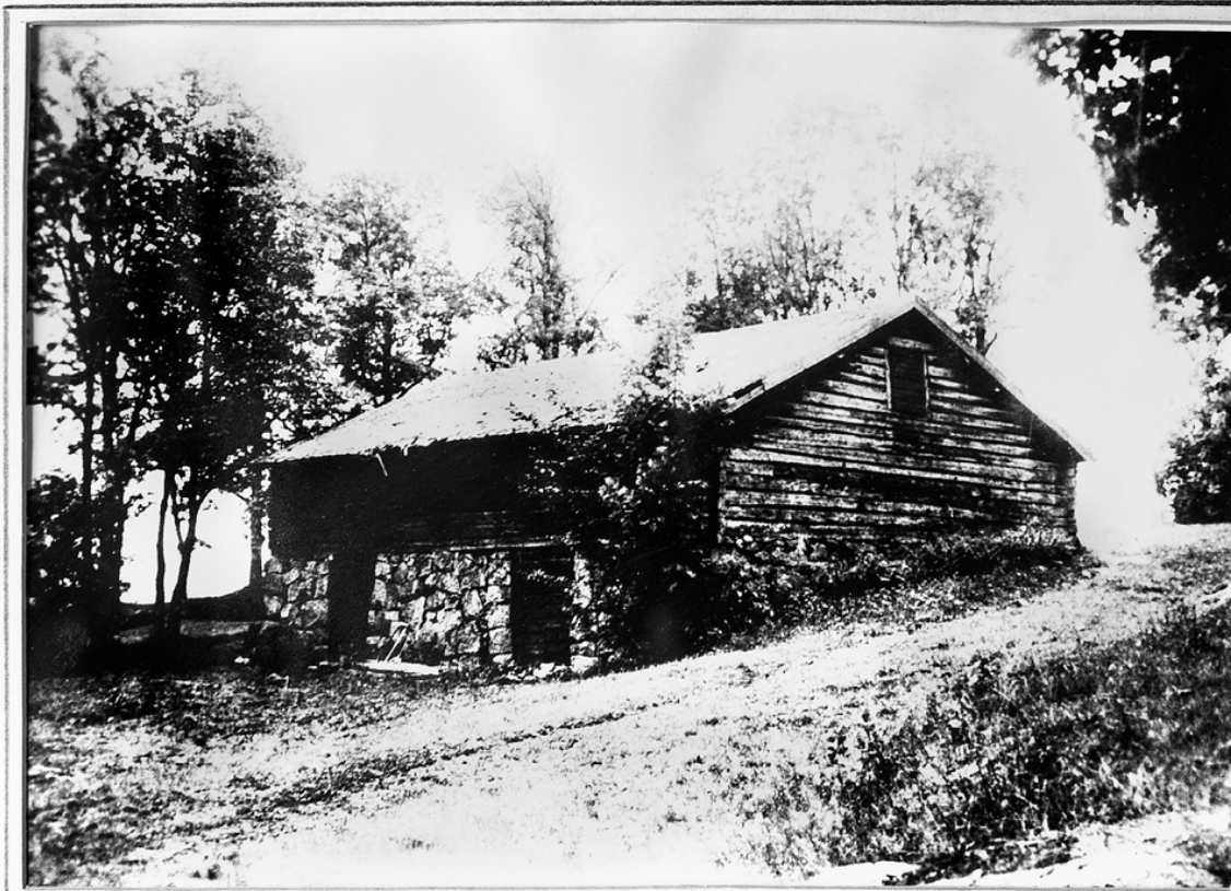
Järnboden L1981:4689. Endast grunden finns kvar.