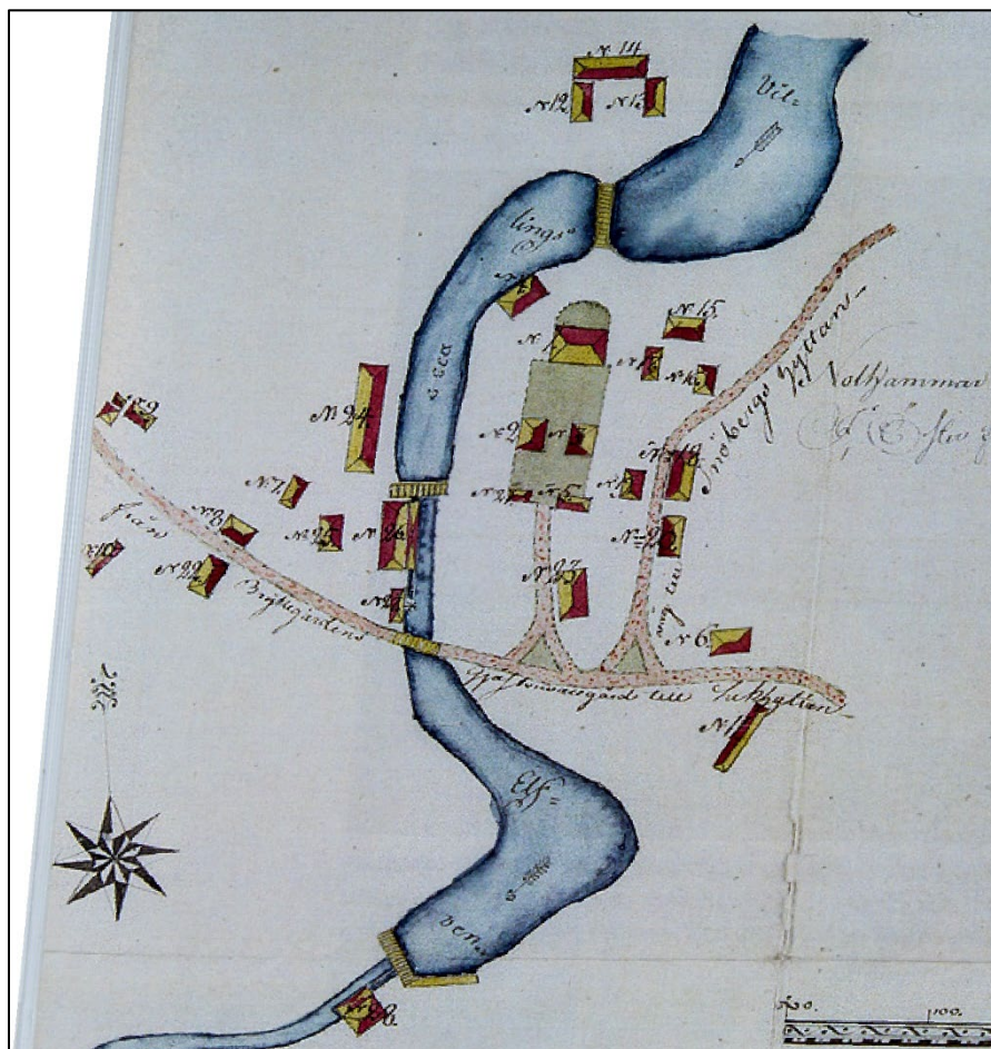
Brandförsäkringskarta från år 1805–1806.