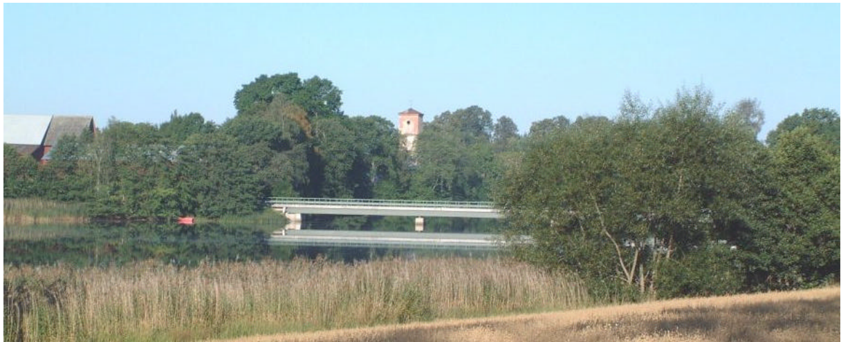
Bron över Motala ström i riksintressets norra del.

För att komma till Ljung söderifrån måste man passera över Göta kanal. Här finns två rullbroar över kanalen, Ljungs östra byggd år 1880, och Ljungs västra byggd år 1890. Dessa båda broar ligger utanför Ljungs riksintresse och ingår istället i riksintresset för Göta kanal, KE 9, men då de är av stort kulturhistoriskt värde för helhetsmiljön omnämns de även här. Ljungs östra har tilldelats klassificering 1A, d v s bron är en framträdande representant för en viss tids brobyggnadskonst. Ljungs västra har klassificering 1B.