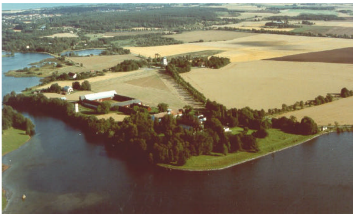
Vy mot sydost. I förgrunden ligger slottsanläggningen. 1991.

Ett par områden inom säteriets egendom nyttjades tidigt till täkt. En sandtäkt fanns strax intill kyrkan och lertäkter fanns både norr och söder om kyrkan samt öster och sydost om tegelbruket. De gamla lertagen har numera förvandlats till tallplantering samt betesmark. De vattenfyllda schaktgroparna har delvis nyttjats till fiskodling.