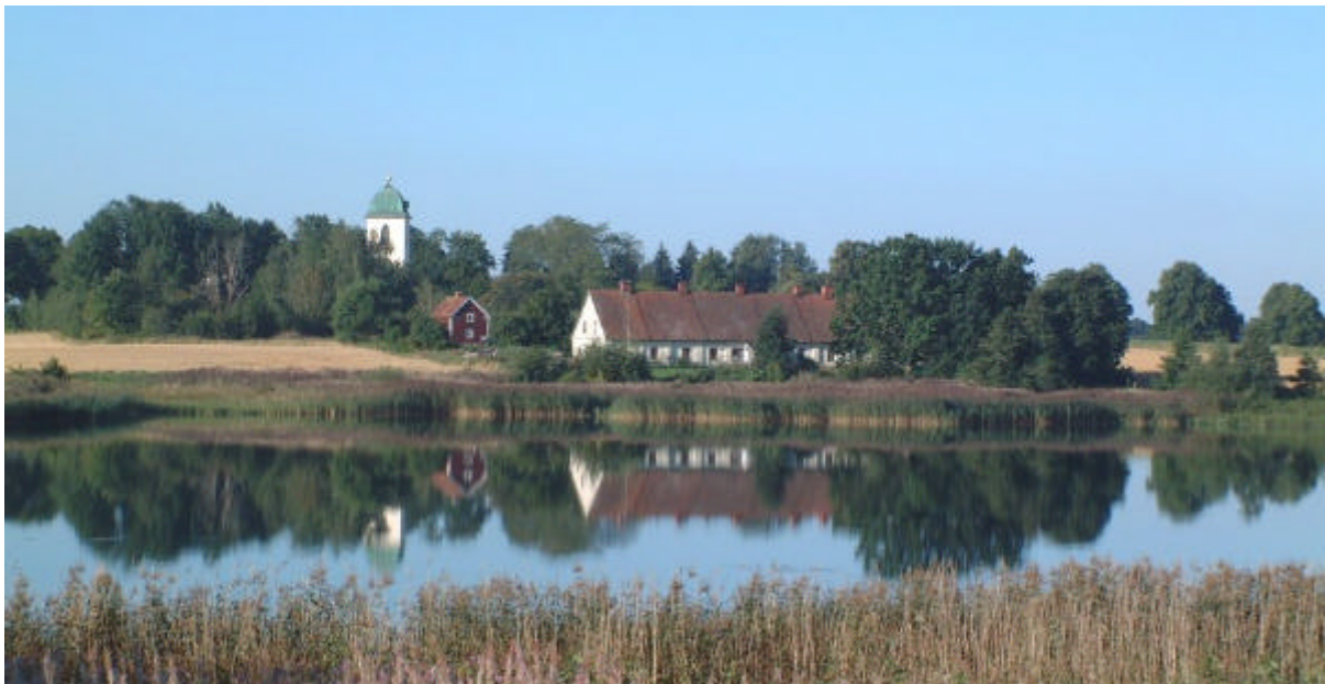
Vy mot Ljung. I förgrunden Motala ström.

Till kyrkbebyggelsen hör även det sk ”Fårhuset” samt ett torp i form av en rödfärgad enkelstuga från 1800-talets förra hälft. Till den yngre bebyggelsen kan räknas en brandstation samt ett förfallet fd metallgjuteri.