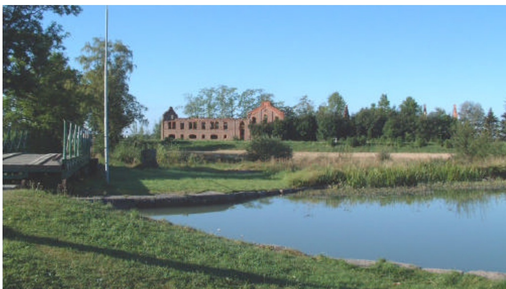
Socketbruket. I förgrunden bron vid Ljungs östra över Göta kanal.

För att komma till Ljung söderifrån måste man passera över Göta kanal. Här finns två rullbroar över kanalen, Ljungs östra byggd år 1880, och Ljungs västra byggd år 1890. Dessa båda broar ligger utanför Ljungs riksintresse och ingår istället i riksintresset för Göta kanal, KE 9, men då de är av stort kulturhistoriskt värde för helhetsmiljön omnämns de även här. Ljungs östra har tilldelats klassificering 1A, d v s bron är en framträdande representant för en viss tids brobyggnadskonst. Ljungs västra har klassificering 1B.