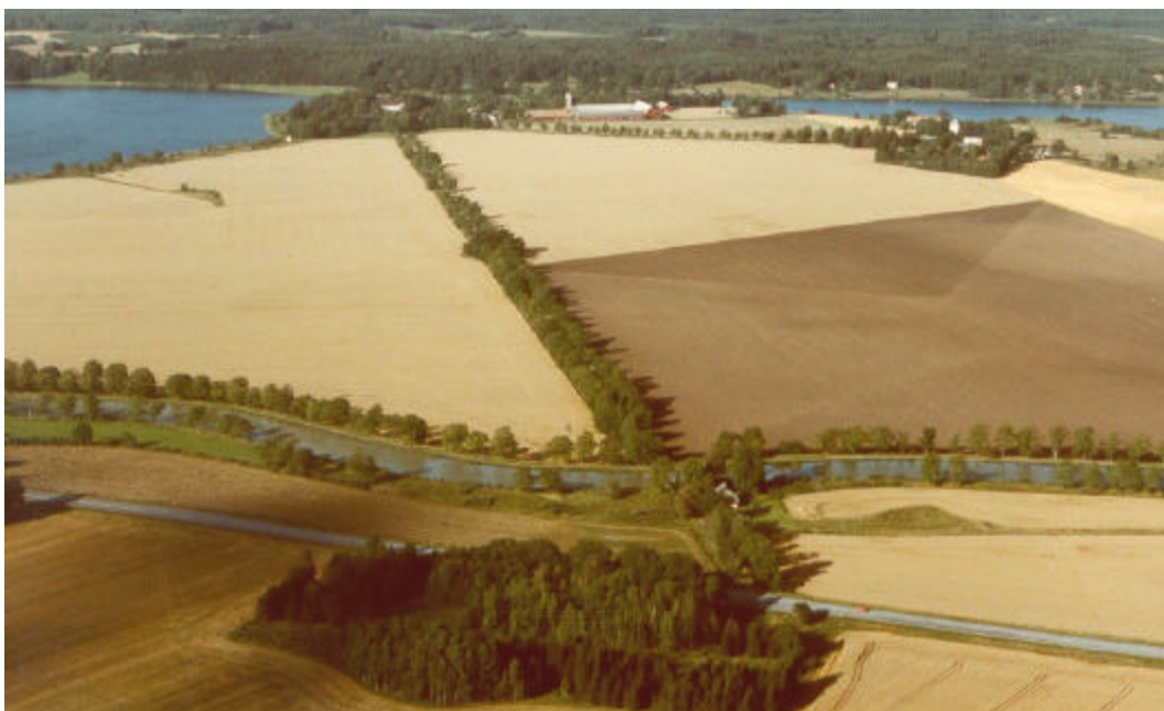
Vy över riksintresset, mot NNO. 1991.

Riksintresseområdet omfattar i stort sett godsets omfattning på 1800-talet. Området avgränsas av Motala ström, Göta kanal samt gränsen mot Slätas åkermark.