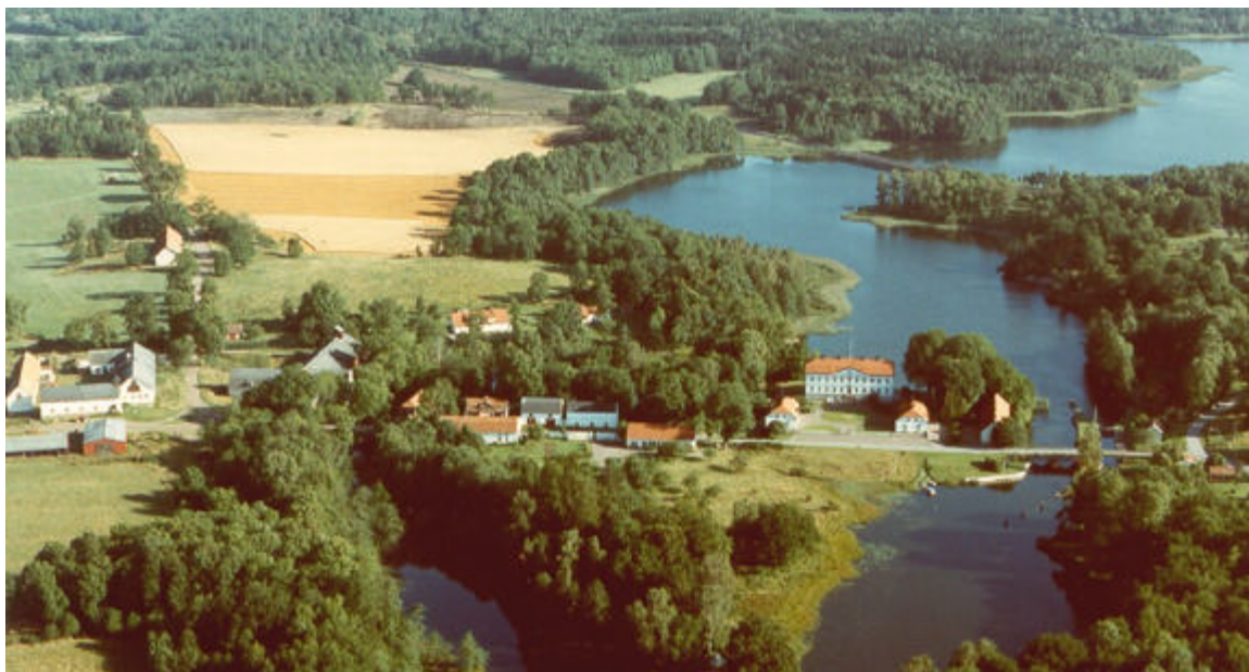
Brokind, mot norr. 1991.

Brokind var en viktig knutpunkt för resande. Sedan gammalt passerade kalmarvägen rakt över holmen och godsets tre broar. Här förlades redan vid 1800-talets början en sluss för att förena sjöarna och som så småningom blev Kinda kanalsystem. Det gamla området spelade ut sin roll som viktig vägknut,