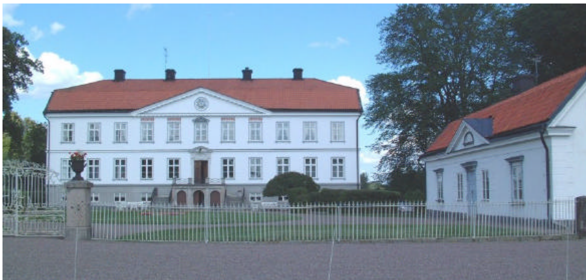
Brokinds herrgård, huvudbyggnaden samt östra flygeln.