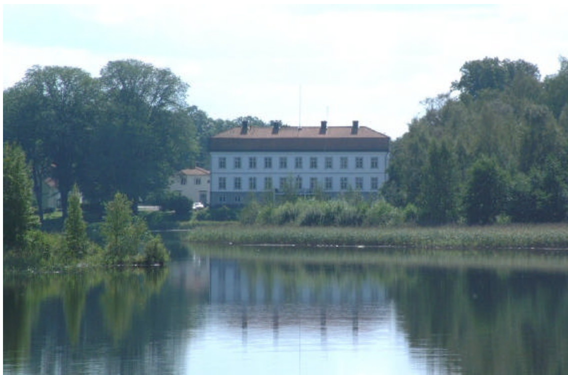
Vy mot Brokind's herrgård. I förgrunden sjön Lilla Rängen.

Under 1600-talet anlades en djurgård vid Brokind. Djurgården var ett inhägnat område, där man uppfödde rådjur. Vid 1700-talets början var dock djurgården övergiven och hade förvandlats till äng och hästhage. Numera finns dock ett vilthägn i områdets östra del. Gravfältet, fornlämning 27, samt stensättningarna, fornlämning 101, ingår i det inhägnade området. Nämnas kan, att väg 34 inom nästan hela riksintresseområdet kantas av viltstängsel.