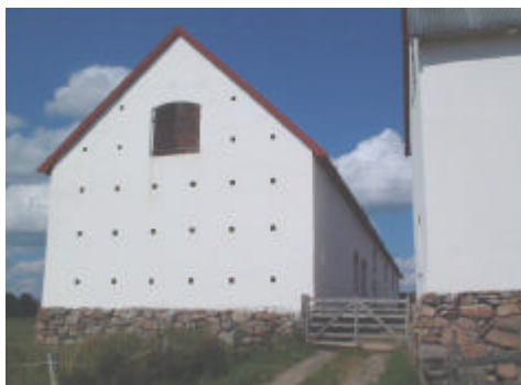
Länga i den kringbyggda ladugården.

På fastlandet väster om ön ligger den vitputsade kringbyggda fägården från 1765 och tillbyggd 1884. Ladugårdens väggar av tegel är vitputsade. Byggnaden är försedd med en vällingklocka. Öster om ladugården ligger en loge, vilken inrymde gårdens tröskverk från 1800-talets början i vitputsad tegel samt rödfärgad stående panel. Samtliga ekonomibyggnader renoverades 1994-95.