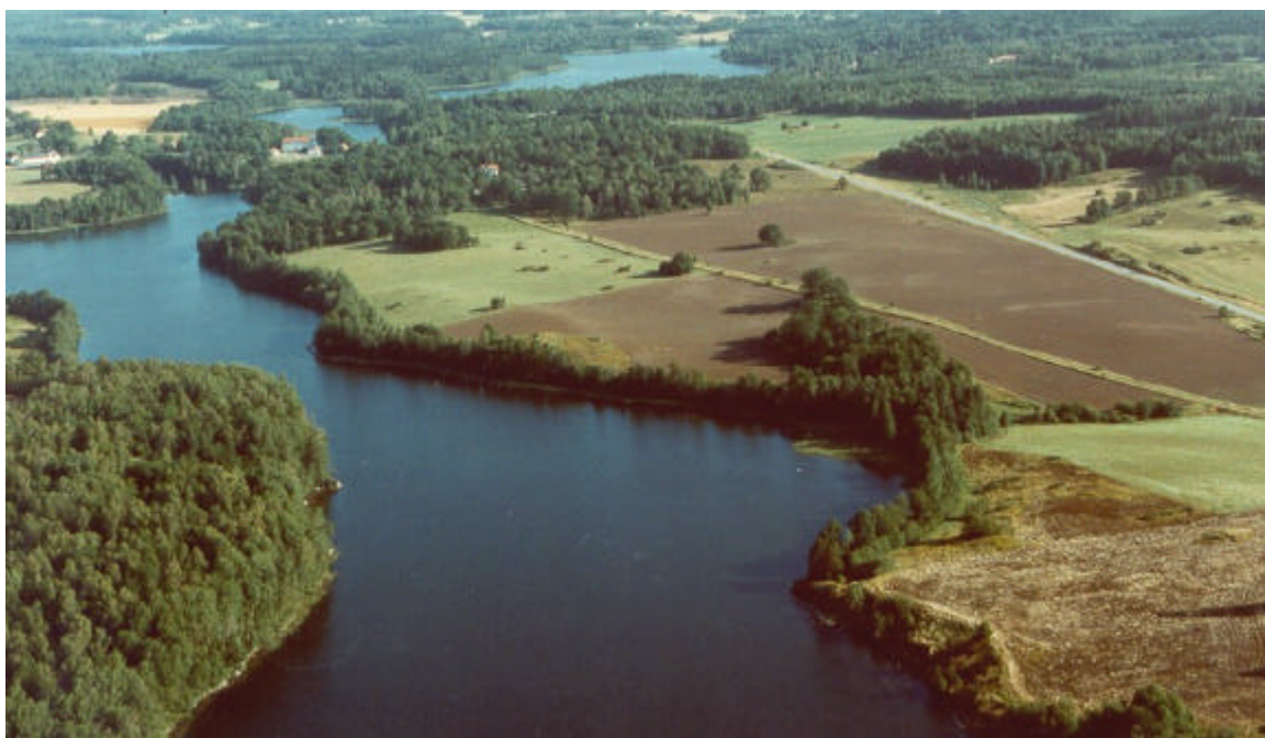
Vy över Brokind, mot norr. 1991.

Landskapet präglas av ett mjukt kuperat moränområde mellan berg och höjdsträckningar och sjön Järnlunden. Det präglas av omväxlande åkrar och stora ekhagar av stort naturvårdsintresse. Inom området ligger sex gravfält, belägna i hagmarkerna.