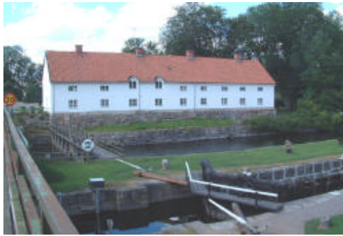
F d mejeriet.

Söderut, axiellt från manbyggnaden, ligger parken med ett lusthus av tegel, ett badhus av resvirke samt ett trädgårdsbord med tälttak, det sk paraplyet, vilket renoverades 1985.