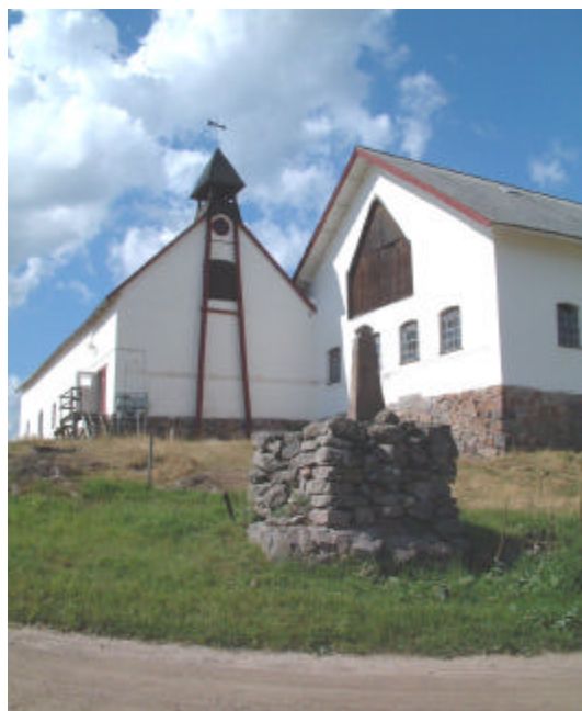
Milstolpe vid vägskalet framför ladugården.

Brokind var en viktig trafikknut och ett värdshus uppfördes invid sundet omkring 1760 i form av en vitputsad timmerbyggnad med brutet tak. Tydligt gick rörelsen bra och vid 1700-talets slut uppfördes en större byggnad i samma stil strax intill, dit värdshusrörelsen flyttade. Värdshuset upphörde vid 1800-talets slut och huset ombyggdes till affär. Det gamla värdshuset blev mjölnarbostad.