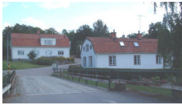
F d Krogen (i förgrunden) och f d affären.

På fastlandet väster om ön ligger den vitputsade kringbyggda fägården från 1765 och tillbyggd 1884. Ladugårdens väggar av tegel är vitputsade. Byggnaden är försedd med en vällingklocka. Öster om ladugården ligger en loge, vilken inrymde gårdens tröskverk från 1800-talets början i vitputsad tegel samt rödfärgad stående panel. Samtliga ekonomibyggnader renoverades 1994-95.